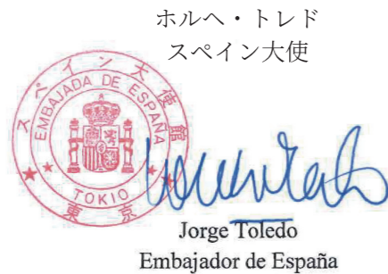
ホルヘ・トレド スペイン大使

今年もこのコンクールが、情熱的で教育的、かつ参加者が自身の優れた技量を披露し、日本の次世代の偉大なギター奏者としての地位を確立する盛況な会となることと確信しております。